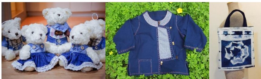
ภาพที่ 2 ผลิตภัณฑ์ต้นแบบตัวอย่างที่ถูกนำไปใช้ในการประเมินความพึงพอใจ

นอกจากนี้จากการศึกษายังพบว่าหน่วยงานที่เกี่ยวข้องส่วนใหญ่มักจะให้ความสำคัญกับการส่งเสริมด้านการพัฒนารูปลักษณ์ของผลิตภัณฑ์เอกลักษณ์ผลิตภัณฑ์การควบคุมราคาให้เหมาะสมกับมาตรฐานผลิตภัณฑ์และการส่งเสริมการขายในขณะที่ผู้ประกอบการที่มีชื่อเสียงของตำบลทุ่งโฮ้งจะมุ่งเน้นไปที่การพัฒนารูปแบบผลิตภัณฑ์และช่องทางการจัดจำหน่ายเพื่อสร้างชื่อเสียงและยอดขายให้